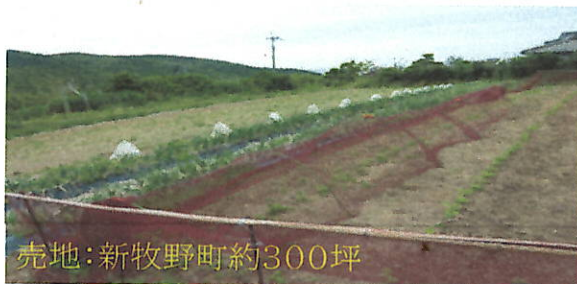
売地: 新牧野町約300坪