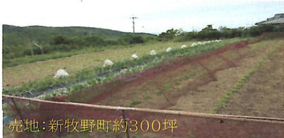
売地：新牧野町約300坪