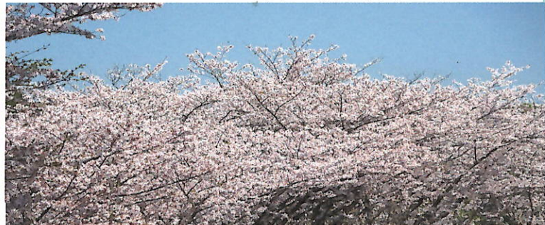
長崎市さくらの里運動公園の県道沿いの桜街道。